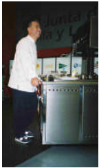
Nobu durante Madrid Fusión 2004

Por 22da ocasión, Wolfgang Puck, Master Chef y reconocidísimo restaurador, y Babara Lazaroff, diseñadora de restaurantes, encabezan el American Wine & Food Festival, un evento que une a un elenco estelar de medio centenar de talentosos chefs internacionales y unos 60 bodegueros. El Festival tendrá lugar el 2 de octubre en Universal Studios en California y los fondos recaudados se destinarán a apoyar los programas Meals-on-Wheels, proveyendo sobre 250 mil comidas calientes a ancianos y discapacitados de la ciudad de Los Angeles. Desde su fundación en 1982, el festival encabezado por Puck ha ayudado a recaudar sobre diez millones de dólares para Meals-on-Wheels.